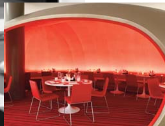
La Terrasse du Parc