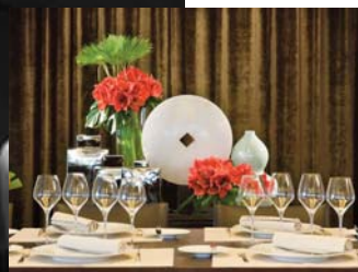
Les Hauts de Lille